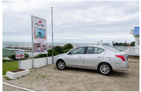
Gansbaai Great White Shark Tours

De regreso a Hermanus voy haciendo planes mentalmente para poder combinar los días y regresar el día 15 a Gansbaai.