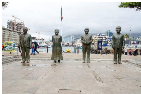
Monumento Nobel Square

captura fotográfica del gran Tiburón Blanco. Llego sobre las diez a la ciudad costera, no tiene nada destacable, excepto un faro, que ya visite en mi anterior visita a la ciudad.