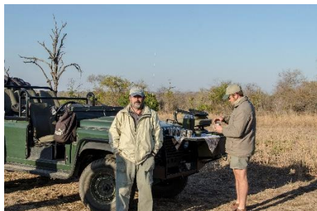
Todoterreno Land Rover

Los safaris se realizan en vehículos Land Rover y son totalmente descubiertos, los había visto en documentales, pero no los había utilizado nunca en mis anteriores visitas a África, la primera sensación es de indefensión sobre todo si vas en el lado exterior, no hay puertas y tienes todo el cuerpo expuesto si algún animal se acerca.