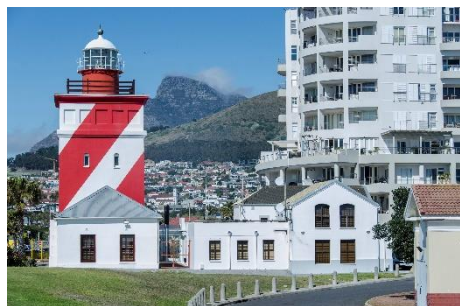
Ciudad del Cabo - Faro de Green

El final de la tarde la dedico a pasear por el litoral y regreso al hotel para preparar el retorno.