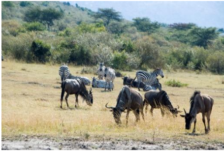
Antílopes Ñu y Cebras

A media mañana llegamos a una zona habitada por Elefantes, hay bastantes y dedicados exclusivamente a alimentarse de arbustos, pasamos un par de horas disfrutando de éstos magníficos animales, siempre con mucha precaución ya que no están muy acostumbrados a ser molestados y muestran algún signo de agresividad, el guía en cuanto ve que alguno despliega sus enormes ojeras, detalle evidente de ponerse en guardia e