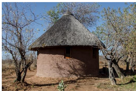
Lodge África on Foot - bungalow