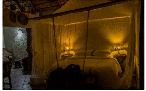
Lodge Umbumbe - bungalow

El bungalow también es diferente, muy espacioso y con la cama rodeada por una tupida red, igualito que en las películas, tendré que ir con cuidado la cercanía del agua me hace suponer que al atardecer habrá muchos mosquitos.