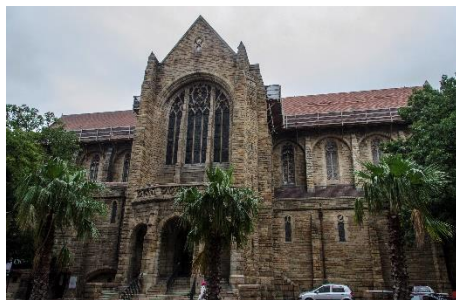
Ayuntamiento - catedral de St. Georges Galería nacional de Sudáfrica - castillo de Good Hope