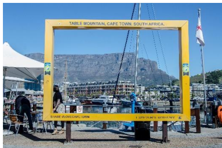
Ciudad del Cabo - Waterfront

El final de la tarde la dedico a pasear por el litoral y regreso al hotel para preparar el retorno.