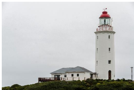
Gansbaai - Danger Point - faro

rápido de volante y esquivarlo. Mi primera intención es parar, imposible, no hay arcén y solo vuelvo a ver el camión un instante por el retrovisor antes de llegar a la siguiente curva.