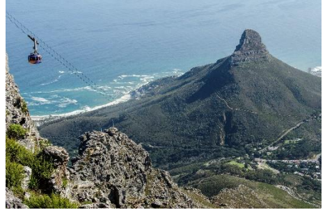
Table Mountain National Park - Ciudad del Cabo