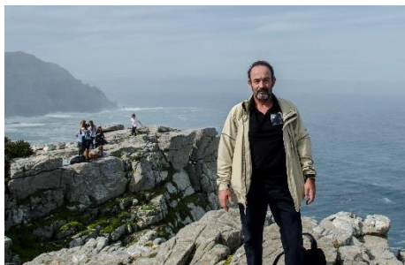
Table Mountain National Park Cabo de Buena Esperanza Cape of Good Hope

Las vistas desde la ubicación del faro son espectaculares, el sendero se estrecha