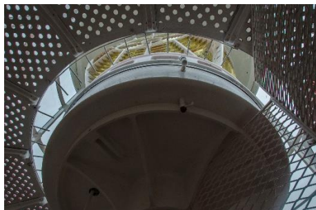
Parque nacional Agulhas - cabo Agulhas - faro