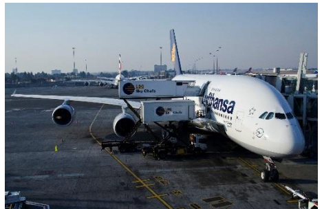
Avión Airbus A380-800 Frankfurt - Alemania

Los vuelos transcurren sin incidencias y a mí llegada a Sudáfrica me está esperando un representante de mi agencia en el país para entregarme toda la documentación necesaria y el primero de los dos coches que usare. Mi primera sorpresa llega en el aparcamiento aeroportuario, me entregan una berlina BMW de gama alta, no es lo que yo esperaba, siempre que viajo y reservo un vehículo mi primera demanda es que sea automático, pero no de una categoría muy alta. El representante me indica que es el único con transmisión automática de que disponen y que no va a tener ningún coste adicional, tras las instrucciones básicas de su funcionamiento me pongo en marcha.