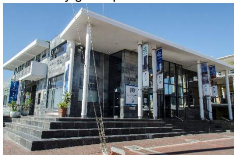
Nelson Mandela Gateway

Aparcar por el centro de la ciudad es imposible, es domingo y está colapsado de vehículos y gente paseando.