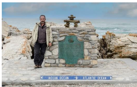
Parque nacional Agulhas cabo Agulhas

Al final del camino hay un pequeño monumento que indica la importancia del espacio y una señal que indica el punto imaginario de la fusión de los Océanos Atlántico e Indico, estoy solo en el lugar así que me apaño como puedo para fijar mi cámara y hacerme una fotografía de mi paso por aquí.