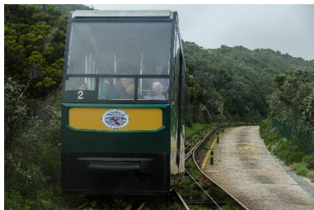
Table Mountain National Park - Cape of Good Hope Parque Nacional de la Montaña de la Mesa - Cabo de Buena esperanza